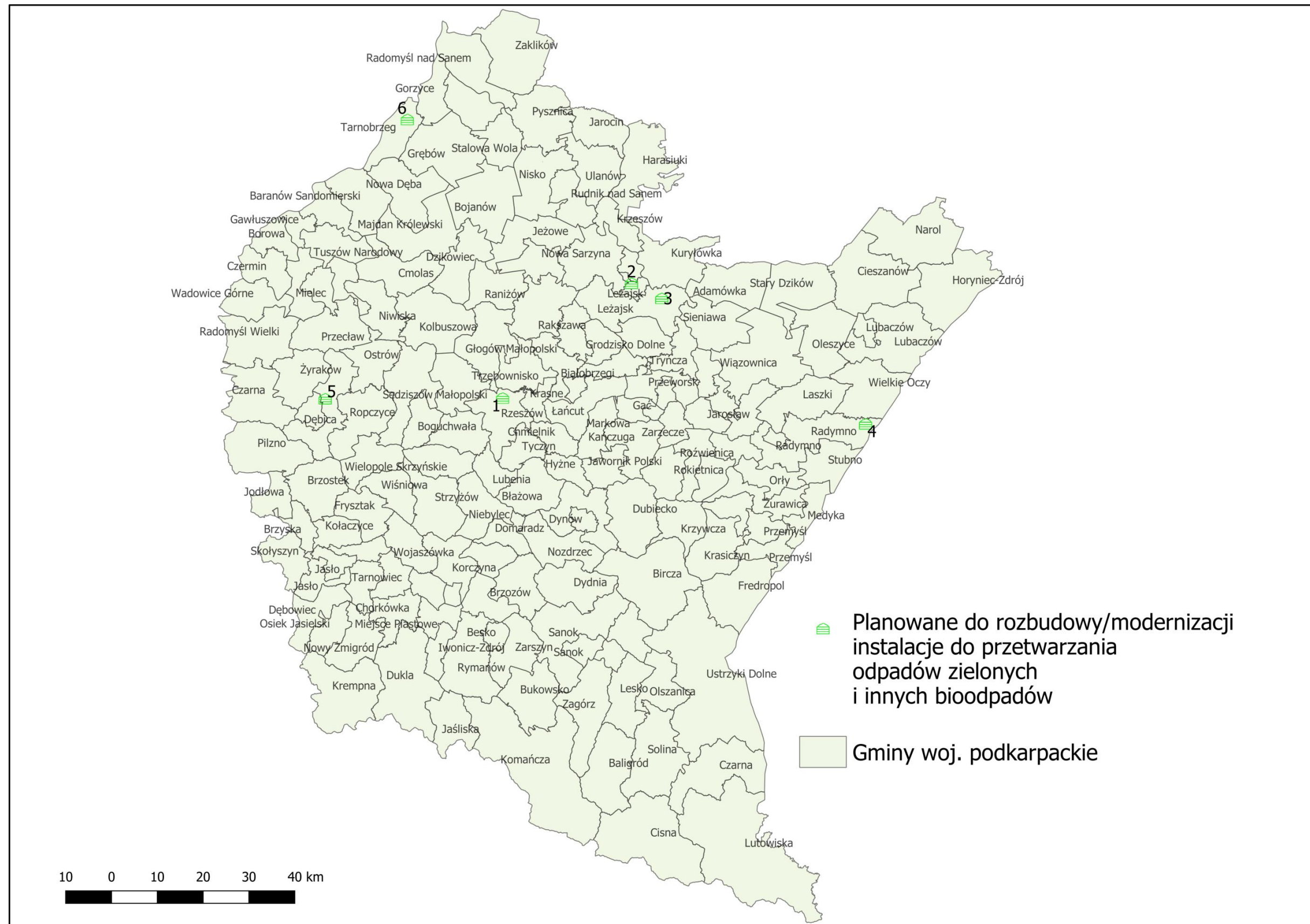
Planowane do rozbudowy/modernizacji instalacje do przetwarzania odpadów zielonych i innych bioodpadów