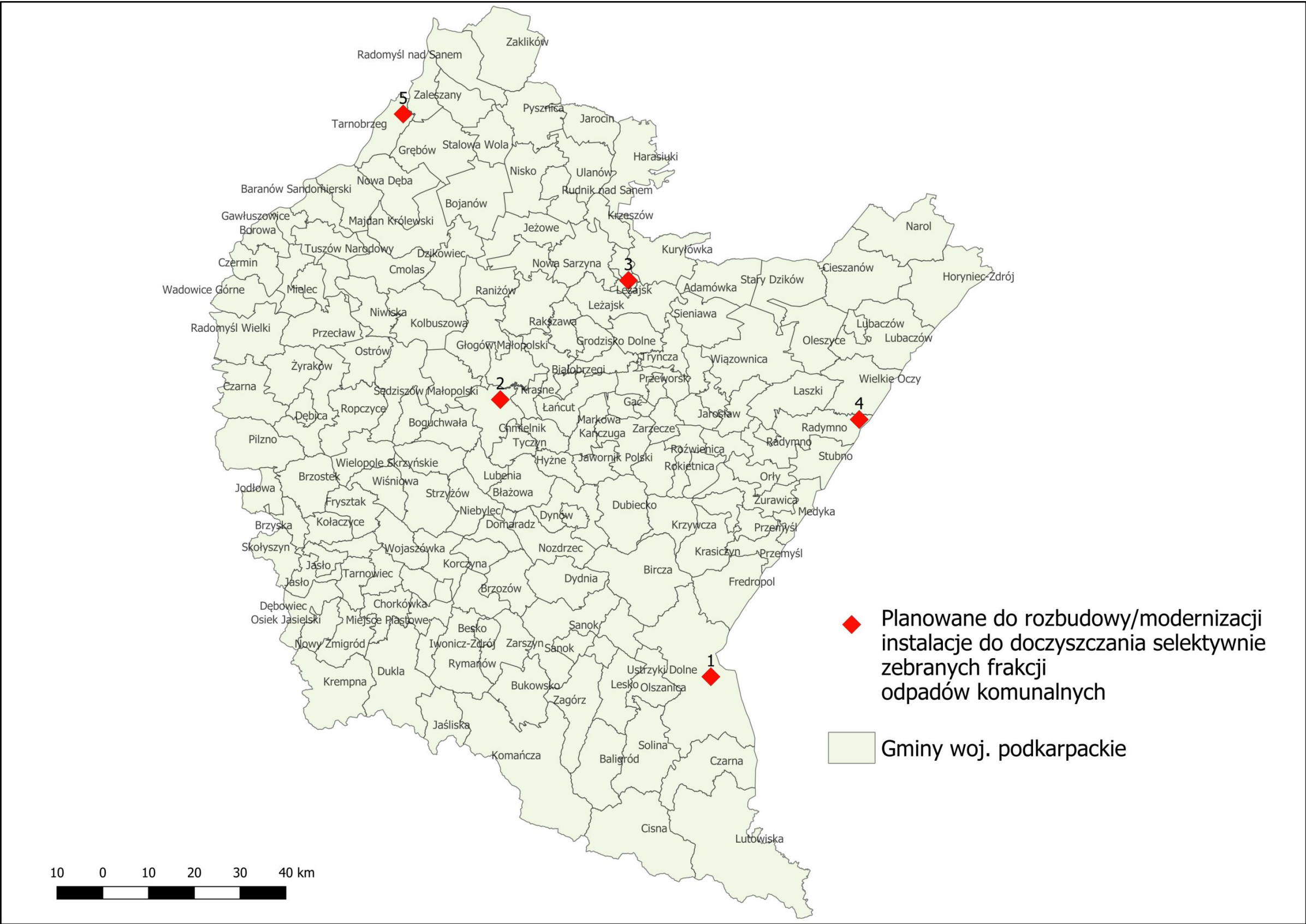
Planowane do rozbudowy/modernizacji instalacje do doczyszczania selektywnie zebranych frakcji odpadów komunalnych