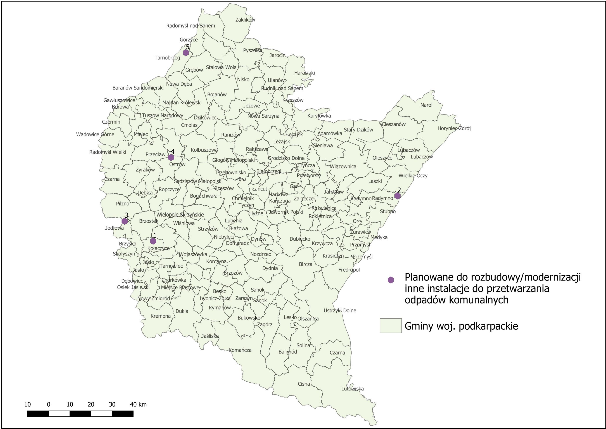
Rysunek 5 Planowane do rozbudowy/modernizacji inne instalacje do przetwarzania odpadów komunalnych